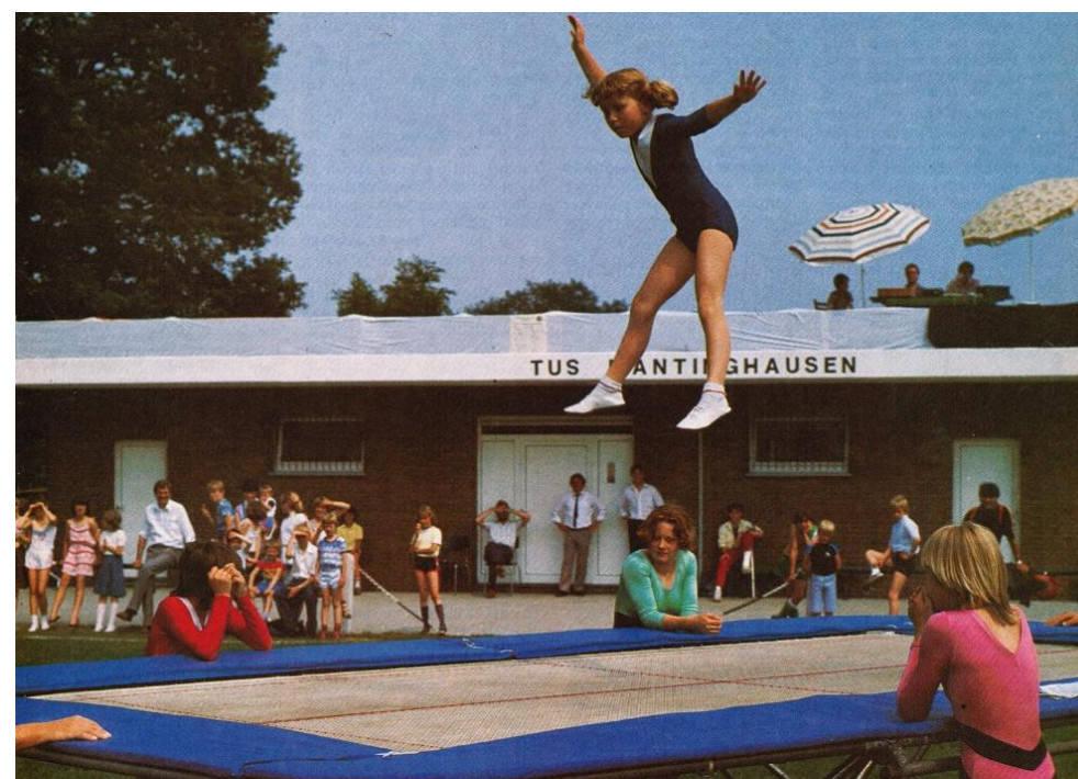
Turnen vor dem alten Sportheim 1984

Neben den Sportarten in seinen Abteilungen bietet der TuS Mantinghausen besondere Aktivitäten, an denen das ganz Dorf teilnehmen kann.