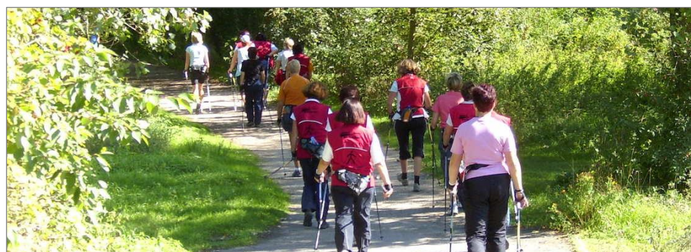
Breitensport z.B. Nordic walking