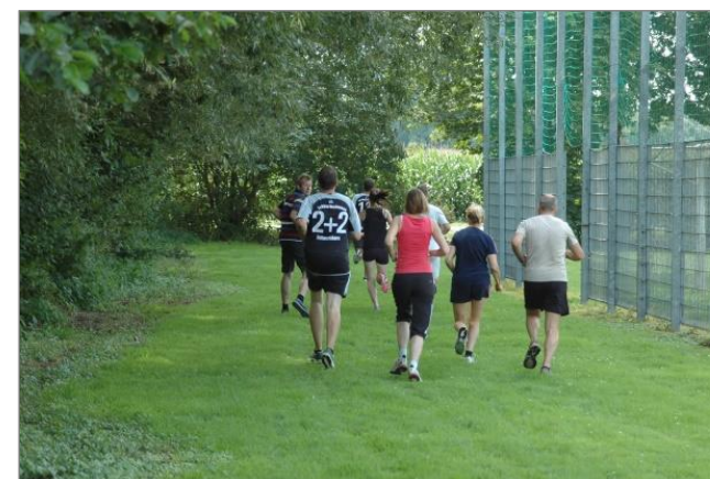
„Mantinghausen bewegt sich“

Neben den Sportarten in seinen Abteilungen bietet der TuS Mantinghausen besondere Aktivitäten, an denen das ganz Dorf teilnehmen kann.